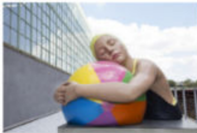
Memorial Shrine with Beach Ball Carole Feuerman © 2011 Carole Feuerman L'opera è stata creata nel 2011.

Le opere esposte sono le Iconics di Carole Feuerman, ovvero le opere più importanti e conosciute dell'artista.