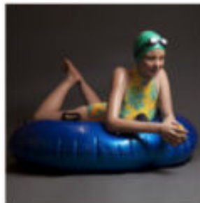
Memorial Shrine Carole Feuerman © 2011 Carole Feuerman L'opera è stata creata nel 2011. Foto: © Carole Feuerman